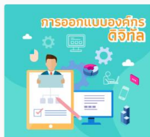
การออกแบบของคิกรดิจิทัล DS10