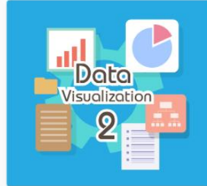
Data Visualization 2 DS02