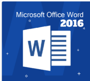
Microsoft Office Word 2016 DS05

ผู้เรียนมีความรู้ ความเข้าใจ เกี่ยวกับการใช้งาน Microsoft Office Word 2016 และ 2019