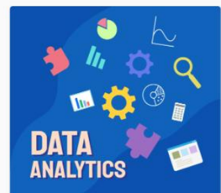
Data Analytics DS12