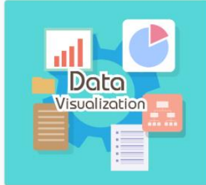
Data Visualization DS01