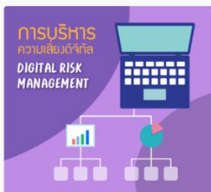
การบริหารความเสี่ยงดิจิทัล... DS09