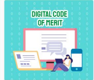
Digital Code of Merit DS04