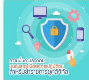
ความมั่นคงปลอดภัยบน... DS03