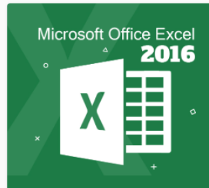
Microsoft Office Excel 2016 DS06

ผู้เรียนมีความรู้ ความเข้าใจ เกี่ยวกับการใช้งาน Microsoft Office Excel 2016 และ 2019