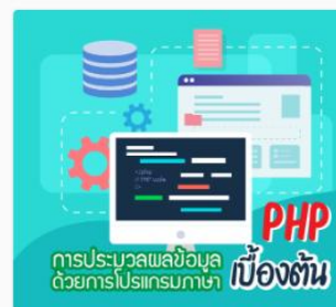
การประมวลผลข้อมูลด้วย... DS11