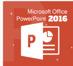
Microsoft Office PowerPoi... DS07