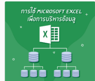
การใช้ Microsoft Excel เพื่อ... DS08