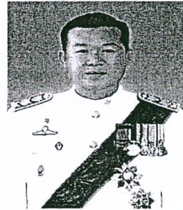
๑๔. นายมรุต จิรเศรษฐสิริ อธิบดีกรมแพทย์แผนไทยและการแพทย์ทางเลือก