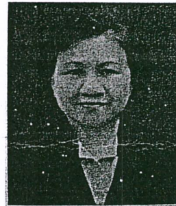
๘. นางนงภรณ์ รุ่งเพชรวงศ์ อดีตรองอธิบดีกรมคุ้มครองสิทธิและเสรีภาพ