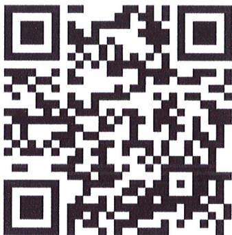
ลงทะเบียนสมัครอบรม