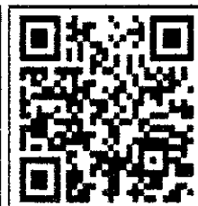
สมัครอบรม