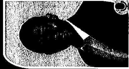
พ.อ.สร.พ.บ.บิษัณห์ สุนสุขเมธ วิทยาลัยแพทยศาสตร์พระมงกุฎเกล้า มหาวิทยาลัยมหิดล