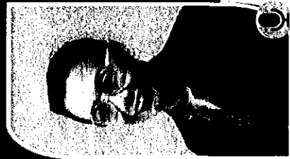
ดร.อัทธยา อินทจักรณ์ คณะแพทยศาสตร์ มหาวิทยาลัยมหิดล